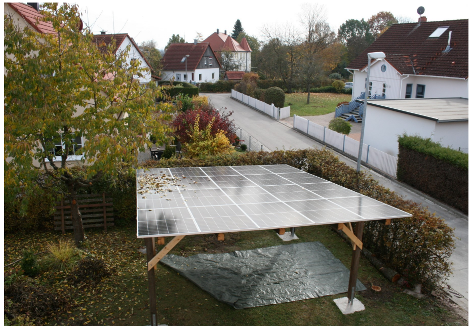
Fertiggestelltes Photovoltaik-Modulfeld als "Carport" getarnt und mit Kirschbaum als Lichtbremse!

Zum Einen wird seine Funktionstüchtigkeit unter Einwirkung starker äußerer elektrischer und magnetischer